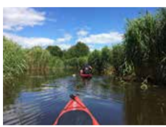
Helge å slingrar sig genom landskapet