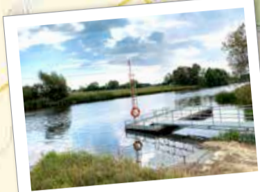
Kavro bro är en bra startpunkt