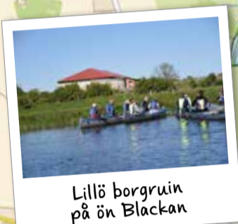
Lillö borgruin på ön Blackan