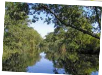
Graften- transportled från 1600-talet