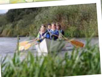
Egeside ger vildmarkskänsla