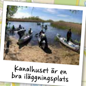
Kanalhuset är en bra iläggingsplats