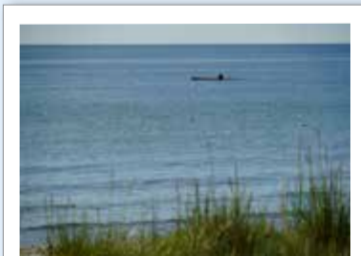
Havet är för den erfarne paddlaren

Från Kavro bro till havet Från Kavro bro (1) strax söder om Hammarsjön kan du paddla till Yngsjö via åns huvudfåra. Längs ån finns fina våtmarksområden med bladvass videsnår och alsumpskog men också betade strandängar. Avsluta turen på södra sidan av Gropahålet (2).