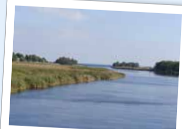
I Gropahålet möter Helge å havet