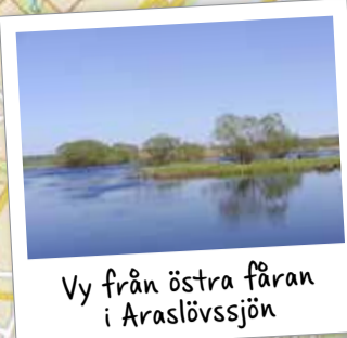
Vy från östra fåran i Araslövssjön