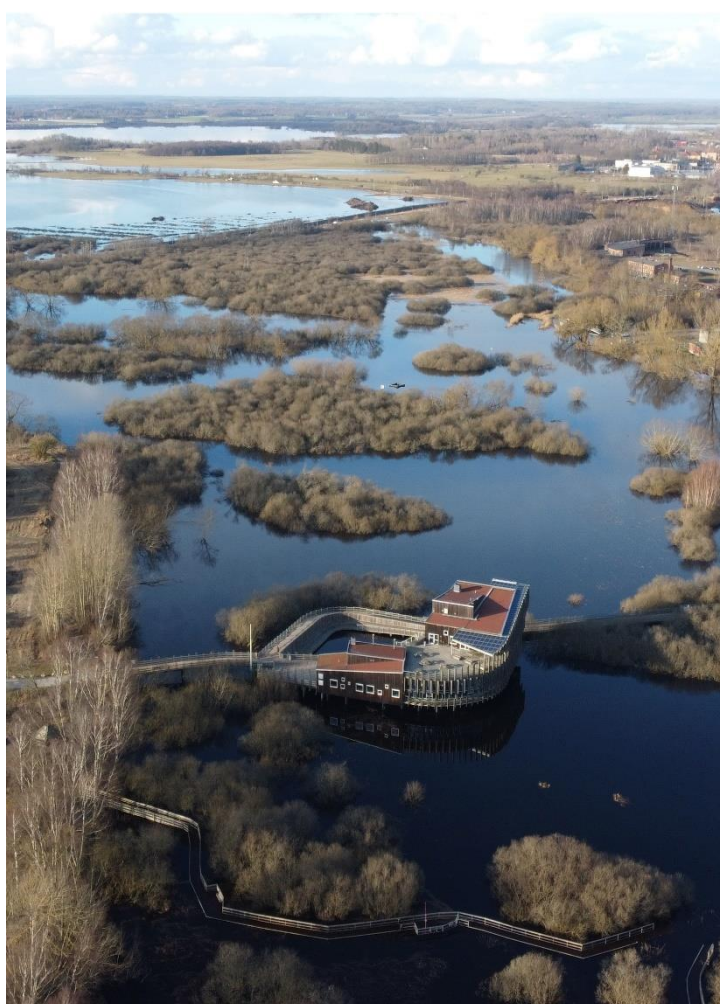
Under vintern 2024 var vattnet högt vid flera tillfällen, på bilden 1,78 m ö h.