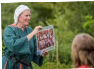
Livet på Lillö

Upptäck den medeltida borgruinen. Ta med fikakorgen, njut av omgivningen och Isteråssets fågelliv. Arrangeras av Vattenrikets vänner.