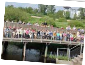
Musik i redet