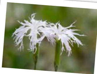
Sandnejlika i Piggastan