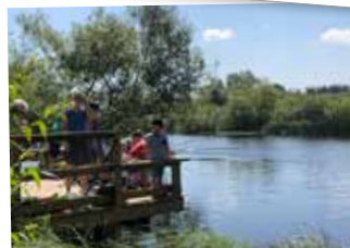
Fiska vid Kanalhuset