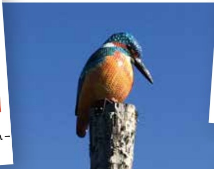
Kungsfiskaren vid naturums infart föll och gick sönder 2016. Med bidrag från vännerna kunde den lagas igen.