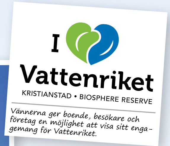
Vännerna ger boende, besökare och företag en möjlighet att visa sitt engagemang för Vattenriket.