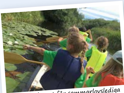
På Biosfärläggret får sommarlovslediga barn möta Vattenrikets natur och människor. Vännerna bidrar ekonomiskt.

Vattenrikets vänner är en ideell vänförening som stöttar projekt och utveckling i Vattenriket. Bli medlem du också!