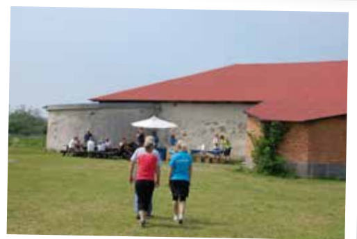
Varje söndag under vår och sommar håller vännerna Lillöborgsen öppen för allmänheten.