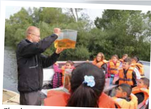
Fler barn kommer ut och upplever Vattenriket tack vare att vännerna stöttar med bussresor åt skolklasser.