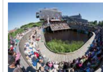
Vacker musik i fin miljö