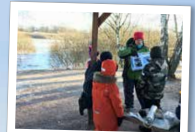
Kluriga uppdrag utomhus

Bli en naturdetektiv! Kom och lös våra kluriga uppdrag och lär dig känna igen olika djurspår i naturen. Vi är vid naturums grillplats och håller brasan igång. Ta gärna med något att grilla.