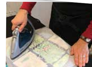
Gör egna bivaxdukar