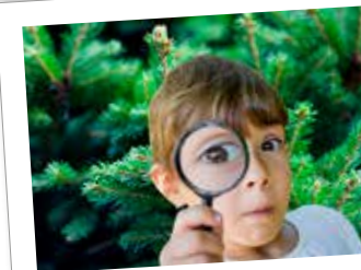
Vem gömmer sig i granen?