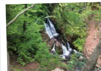
Vattenfall och bokskog i Forsakar.

Sök skugga vid den vackra ravinen som sägs vara ett verk av jättar och hem åt pysslingar, näcken och skogsrädet. Forsakarsbäcken kastar sig ner i flera vattenfall. Slutningarna kläs av bokskog och längre ner ger ormbunkar och mossor en frodig grönska. Promenera längs ravinkanten och se det största vattenfallet på nära håll från en utsiktsplattform. Forsakar ligger vid Degeberga.