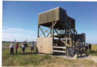
Vadarspaning i Äspet

Samling på Snickarhakens parkering, Äspet. Skåda tillsammans med Nordöstra Skånes Fågelklubb i Äspets fågeltorn. Samarrang-emang med Studieförbundet.