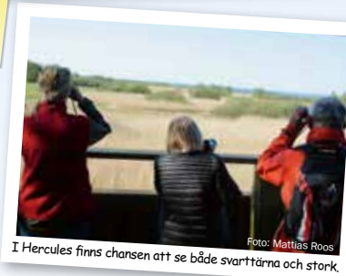
I Hercules finns chansen att se både svarttärna och stork.

Hercules är en rik mosaik av ängar, betesmarker, videsnår, vasshav och dammar. Den 3 km långa stigen passerar utemuseet där utställningen berättar om Hercules natur och kulturhistoria. Från fågeltornet har du fin utsikt över Herculesvikens vasshav. Stigen fortsätter vidare förbi dammar där trollsländor och svarttärnor trivs. Hercules ligger söder om Viby vid Hammarsjöns strand.