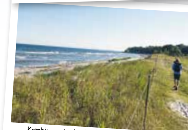
Kombinera bad och fågelskådning vid Äspet.

Fågelskådning passar bra att kombinera med sol och bad i Åhus. Äspet är ett naturreservat som ligger vid stranden, strax söder om Åhus hamn. Det är ett omväxlande område med en grund lagun som lockar många häckande och rastande fåglar. Lagunområdet gränsar till Kronoskogen, en blandskog som är ett populärt rekreationsområde. I anslutning till lagunen finns två fågeltorn och ett nytt utemuseum vid Snickarhakens parkering.