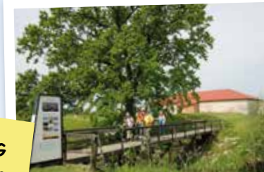
Besök medeltida Lillö borggruin.

ÖPPEN BORG Söndagar och röda dagar kl 11.30-15. 6 maj-9 september Arrangeras av Vattenrikets vänner.