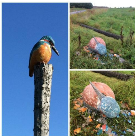
Kungsfiskarstolpen skall på plats igen.