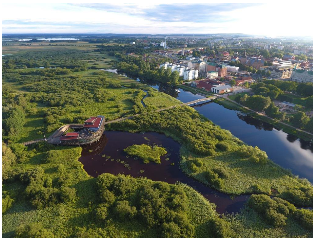
Naturum Vattenriket: mitt i Vattenriket, mitt i Kristianstad.